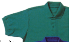
4 エメラルドグリーン