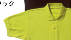
24 アップルグリーン

商品に関するお問合せは tel 03-3352-5435 fax 03-3352-5990 E-mail info@roche.co.jp